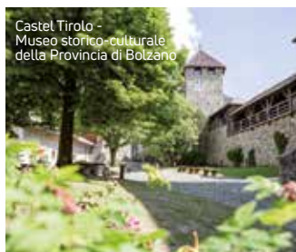
Castel Tirolo - Museo storico-culturale della Provincia di Bolzano