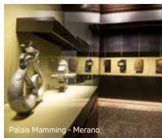
Palais Mammaing - Merano