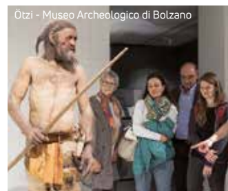
Ötzi - Museo Archeologico di Bolzano

Se volete usufruire della MeranCard per il viaggio di arrivo possiamo volentieri spedirVela a casa se ce lo comunicate per tempo.